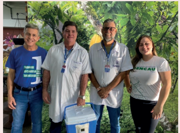
Vacinação é um Sucesso na Gencau SP!