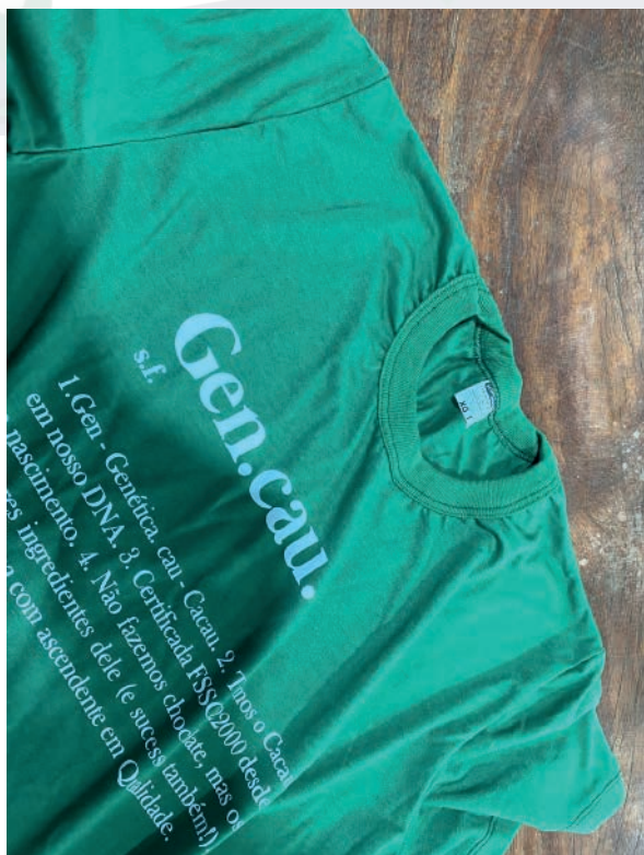
Camiseta comemorativa da Recertificação da FSSC/Dia do trabalho.

Estamos no caminho, time! E somos gratos a TODOS que estão construindo esse legado de tantas conquistas e vitórias.