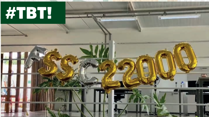
Primeira certificação da FSSC! (2021).