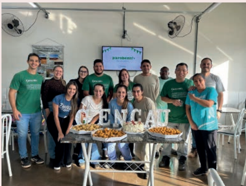
Aniversariantes de Maio, Gencau SP