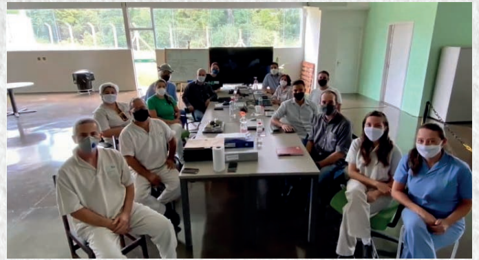
Equipe da primeira auditoria da FSSC

Parabéns a todos que se dedicaram arduamente para que essa grande conquista fosse mantida. Juntos, somos (de novo) FSSC 22000