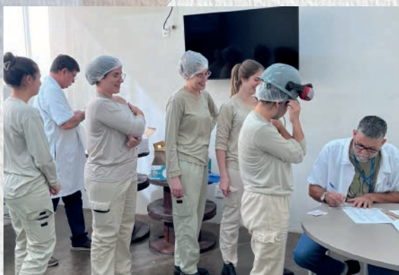
Garotas da Gencau SP se vacinando contra a Gripe!