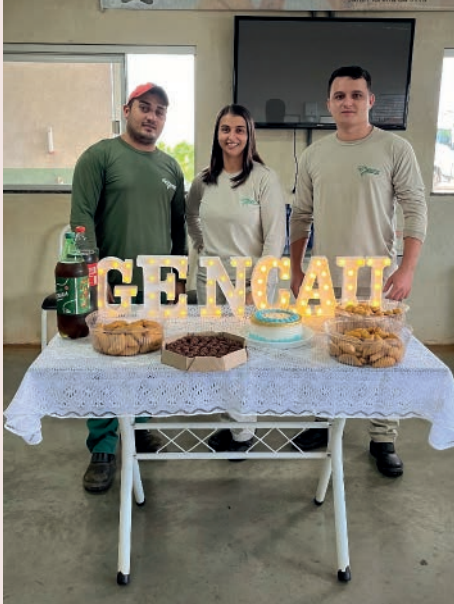
Aniversariantes de Maio, Gencau AM

(Lembrando que dentro da fábrica é proibido tirar fotos).