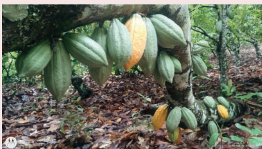
Cacaueiro carregado de frutos