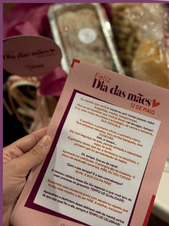
Dia das mães na Gencau é sempre uma alegria.

Desejamos ainda que junto de seus filhos, nunca se esqueçam que para eles, vocês são as melhores. Feliz todo dia, mamães!