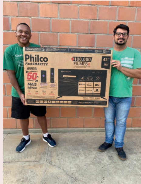
Rincon ganhou a televisão sorteada pelo Jall Supermercado!