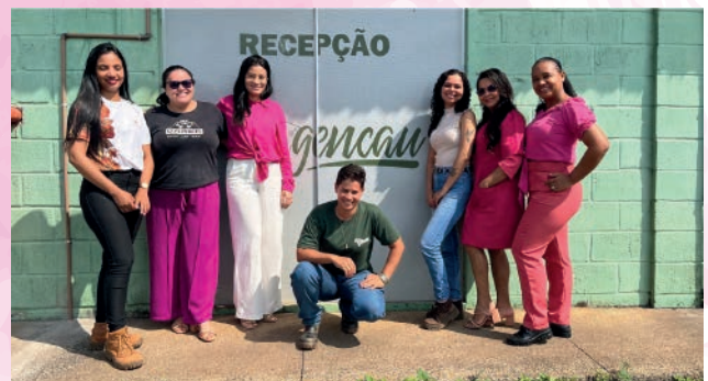
Outubro Rosa na Gencau Amazônia