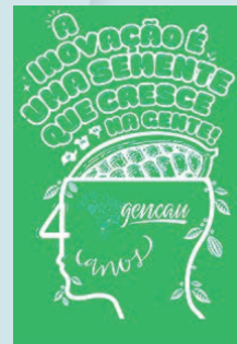
2 Aline Santurbano