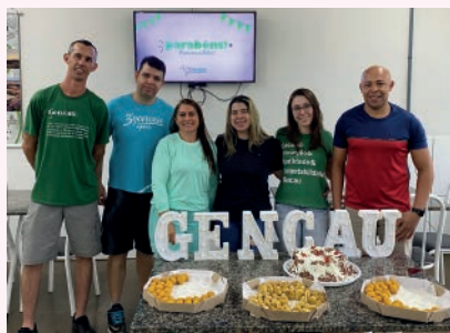
Aniversariantes de Outubro comemoram mais um ano de vida.