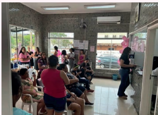
Outubro Rosa junto à sociedade civil é um sucesso!