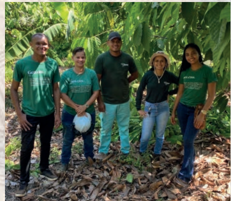
Equipe Gencau no treinamento de poda.

Juntos, fortalecemos a agricultura sustentável e valorizamos quem faz a colheita acontecer!