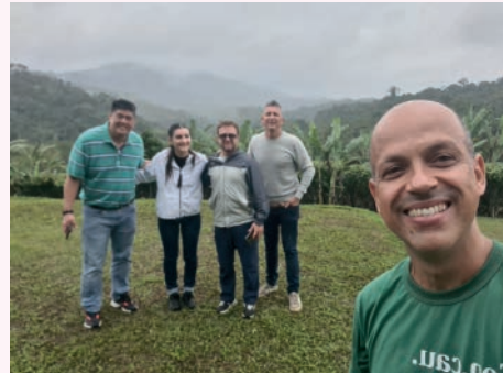
Arcor sendo recepcionada na Bahia.