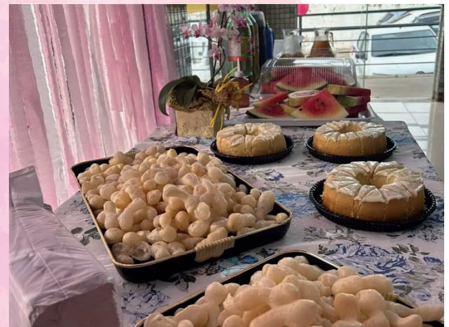
Café da manhã servido em parceria com a casa da mulher.