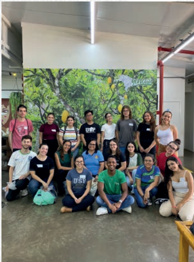
Alunos da USP em visita a Gencau.

A experiência é sempre produtiva e a Gencau está de portas abertas para viver mais histórias como essa!