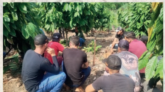
Produtores concentrados na lição:)