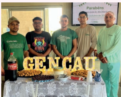
Aniversariantes de Outubro comemoram no Pará!