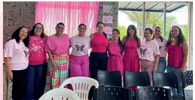
Sabado de prevenção junto a sociedade civil.

Lembre-se: apoiar a saúde das mulheres é uma responsabilidade de todos nós. Juntos, podemos fazer a diferença!