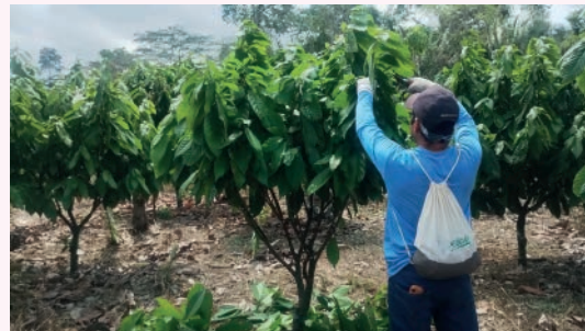
Treinamento de poda gera interação com o produtor e melhora no manejo da produção

(Lembrando que dentro da fábrica é proibido tirar fotos).