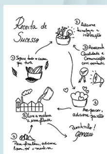
1 Mariane Perle

Por isso, além da grande vencedora, nós também entregamos um mimo para os outros dois colocados.