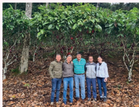
Visita á produtores junto a equipe da Arcor.