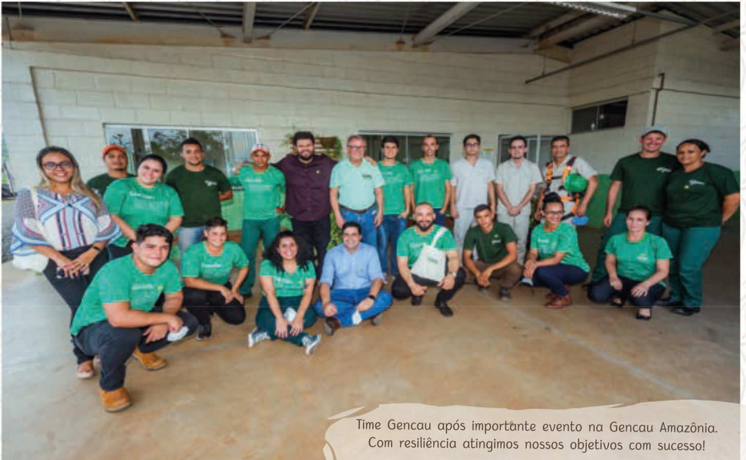
Time Gencau após importante evento na Gencau Amazônia. Com resiliência atingimos nossos objetivos com sucesso!

Valorizar de onde viemos, nossos caminhos e conquistas são atitudes essenciais para a preparação ao futuro. Não existem lugares melhores, apenas diferentes.