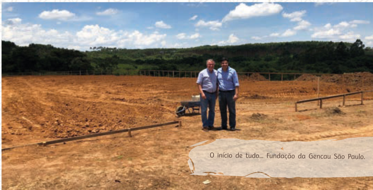
O início de tudo... Fundação da Gencau São Paulo.

Nós, seres humanos, somos todos iguais, porém o que nos diferencia em relação ao tamanho do sucesso que teremos é o tamanho da nossa saciedade. Não há perfeição, não há limites, não há conhecimento completo, ou seja, nunca se chega lá. Isso não é uma má notícia, pelo contrário, é a confirmação de que sempre haverá um ponto mais alto na escalada.