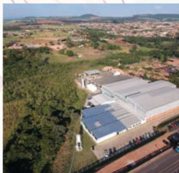
Gencau São Paulo